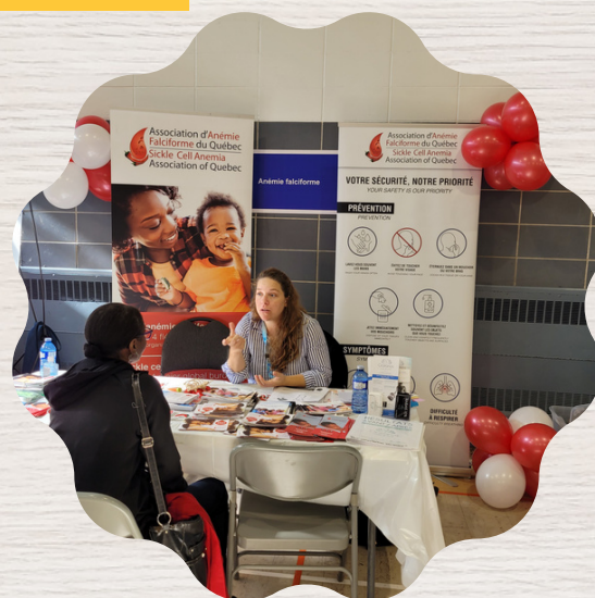
Atelier santé mentale

La foire santé de Montréal-Nord, la collecte de sang à l'église Béthesda, l'atelier de santé mentale sont autant d'activités de l'Association de septembre 2022.